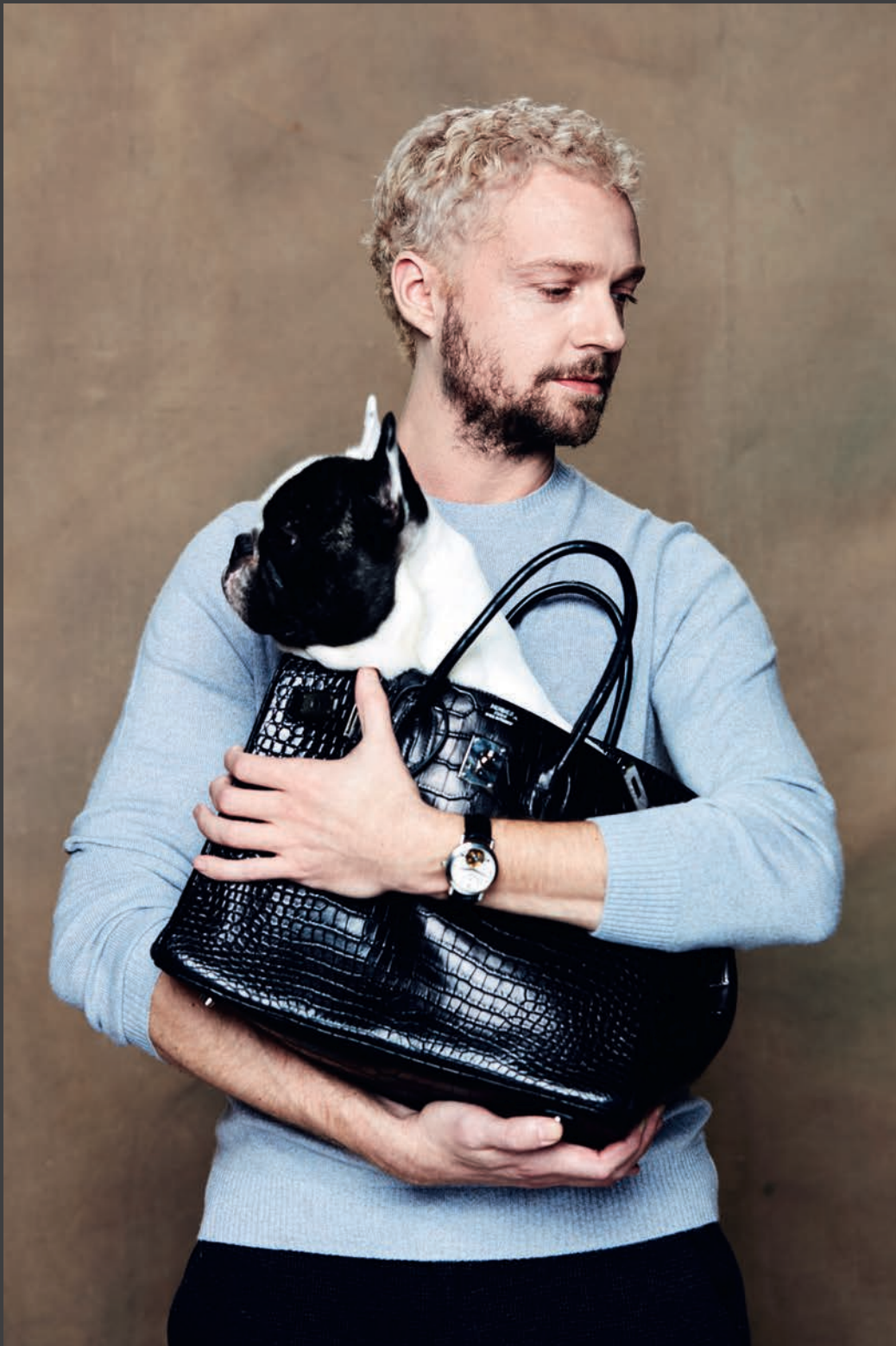
Fred porte un pull en cachemire Virgile gris et un sac Hermès Birkin 35 en crocodile d'estuaire Graphite (lot 1016) et une montre en platine Vacheron Constantin (lot 43)